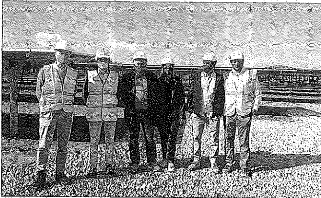
Responsables de Endesa, del Govern y de Protur Hotels visitaron las instalaciones.