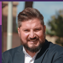
Jaume Llompart Caldés Batle de Marratxí